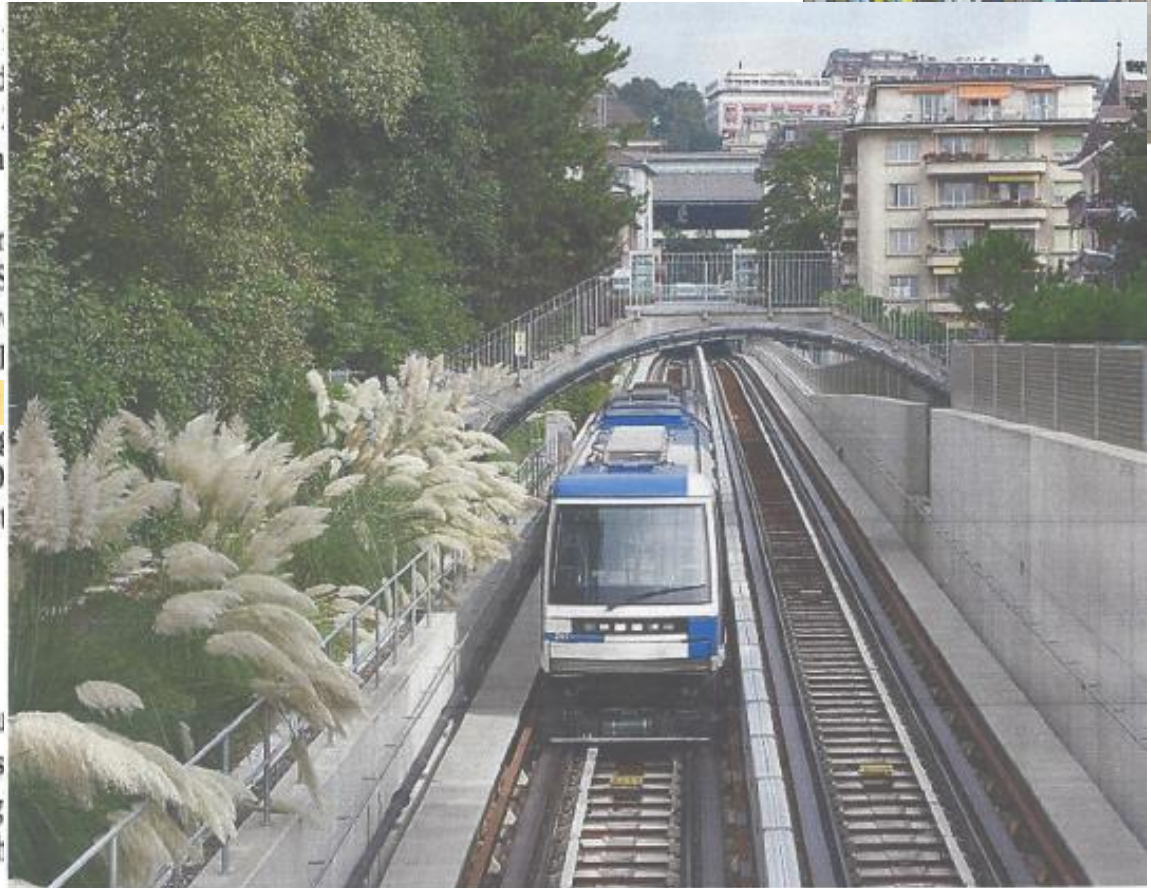
Die Métro-Linie m2 in Lausanne.

Dank dem vollautomatischen Betrieb ka Takt fahren und eine beachtliche Durchs tönt nach wenig – zum Beispiel im Verg Stadtverkehr ist das aber ein guter Durch Lausanne ist.